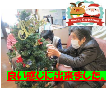
良い感じに出来ました。